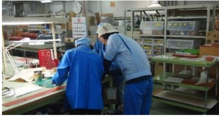
熟練専門技能者育成